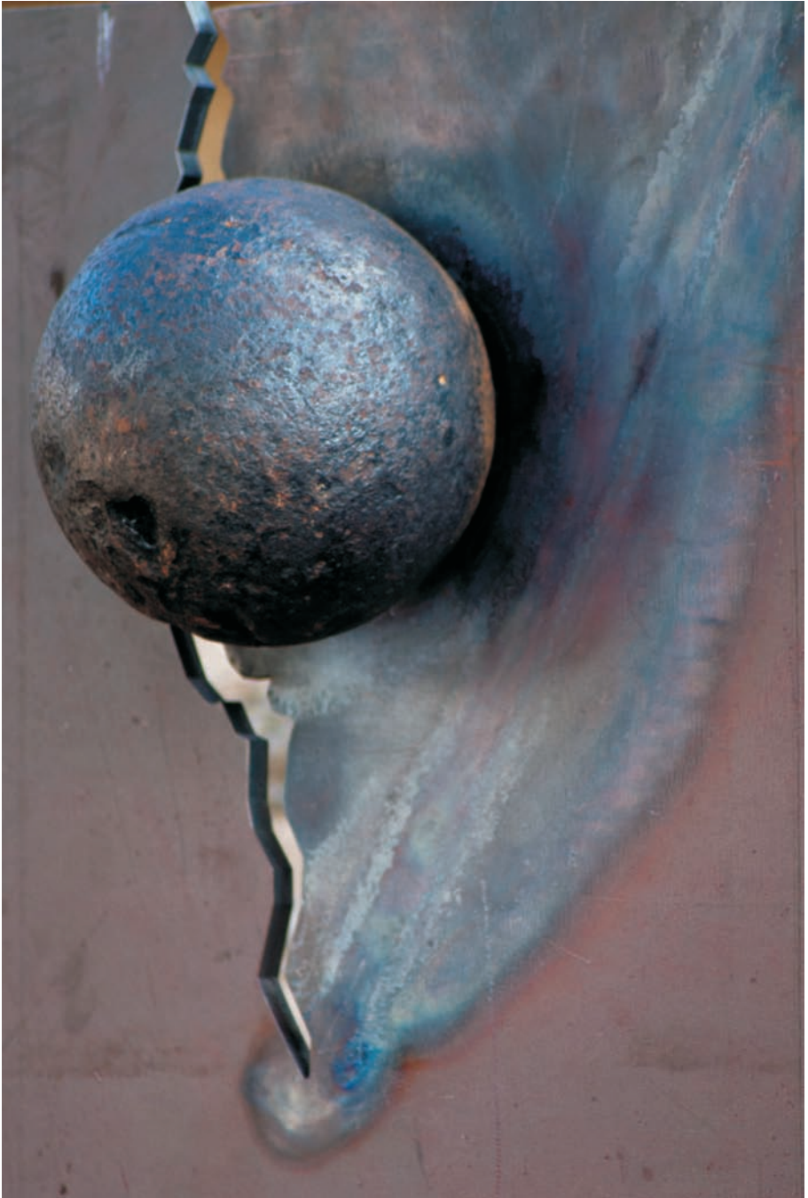
Kanonenkugel-Detail auf der neu eingeweihten Gedenktafel