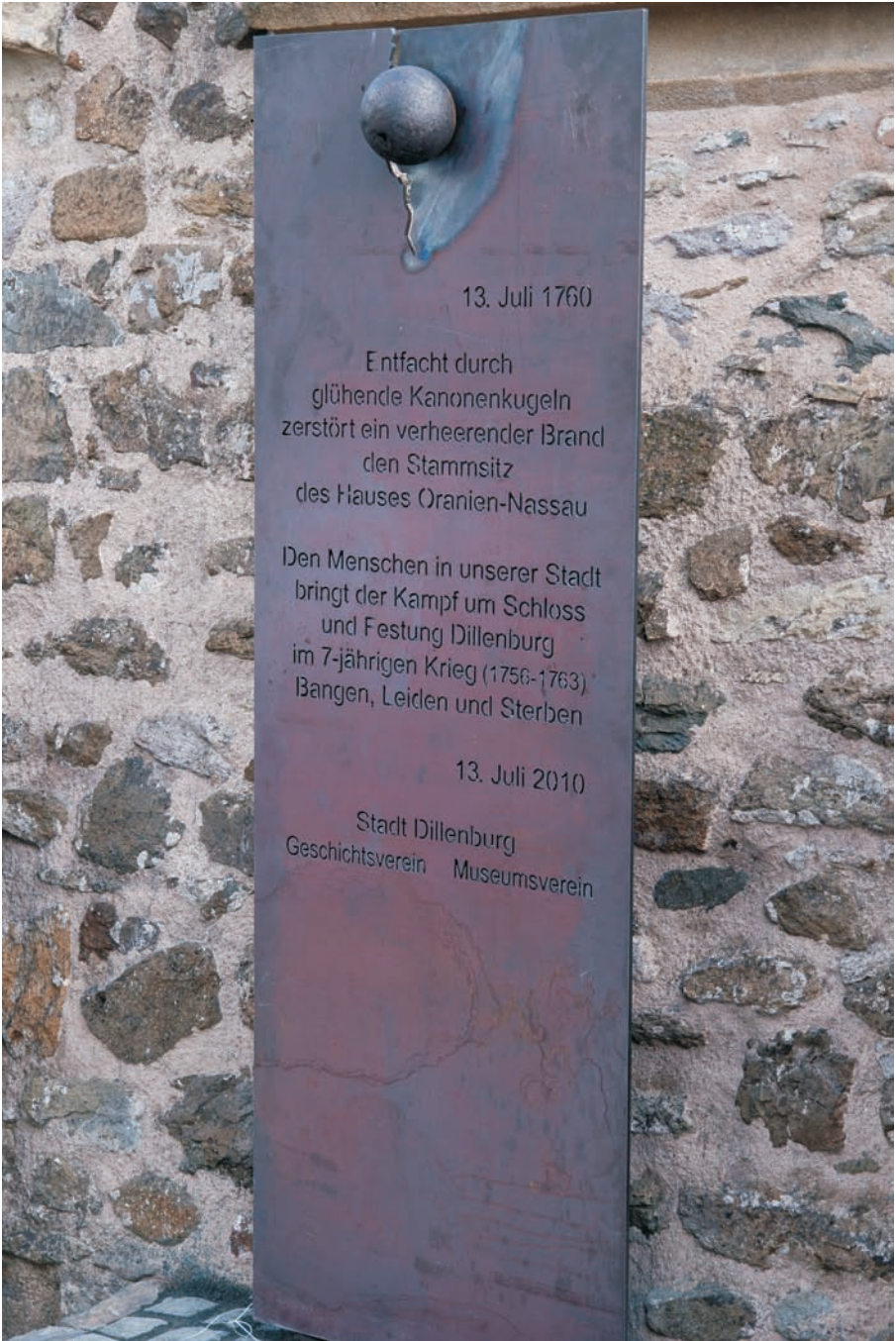
Gedenktafel zur Schlosszerstörung am 13. Juli 1760